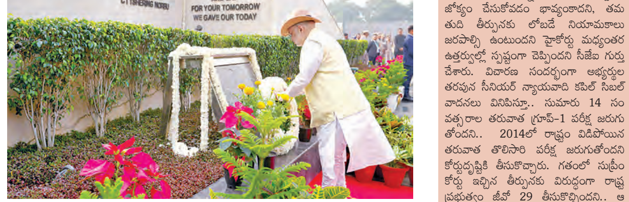
పోలీసు అమరవీరుల సంస్మరణ దినం సందర్భంగా సోమవారం ఢిల్లీలోని జాతీయ పోలీసు మెమోరియల్ వద్ద నివాళులర్పిస్తున్న కేంద్ర హోంమంత్రి అమిత్ షా