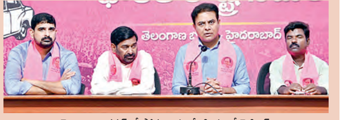
తెలంగాణ భవన్ లో సోమవారం మీడియాతో కెటిఆర్