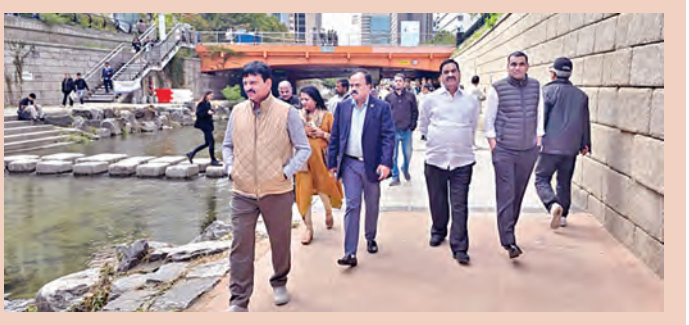
దక్షిణ కొరియా రాజధాని సియోల్ లో పర్యటిస్తున్న తెలంగాణ మంత్రుల బృందం