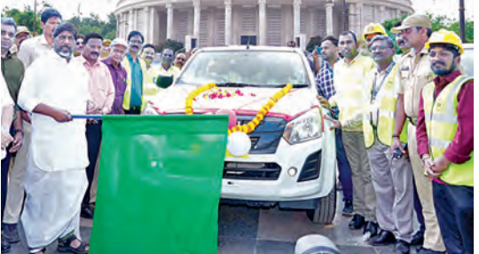
సోమవారం హైదరాబాద్ లో విద్యుత్ అంబులెన్సును ప్రారంభిస్తున్న డి.సిఎం భట్టి విక్రమార్కు

అత్యవసర సేవల కోసం ఏర్పాటు: డి.సిఎం భట్టి