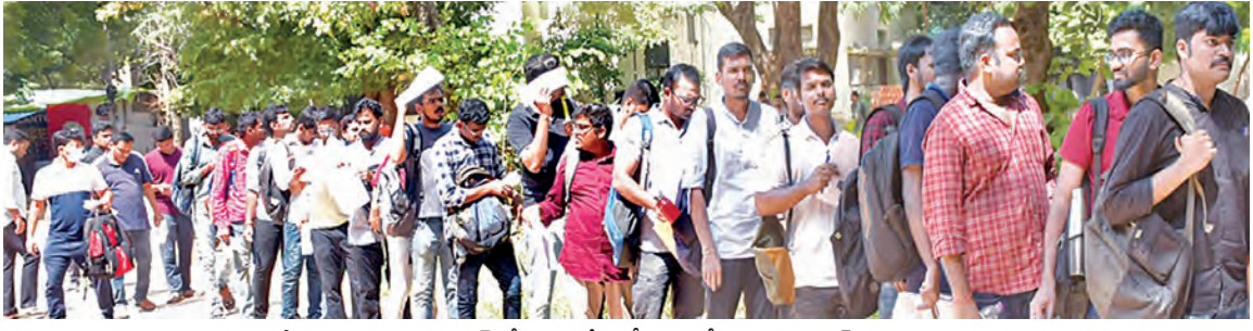
సోమవారం హైదరాబాద్ లోని ఓ పరీక్షా కేంద్రంలోకి వెళ్తున్న గ్రూప్-1 అభ్యర్థులు