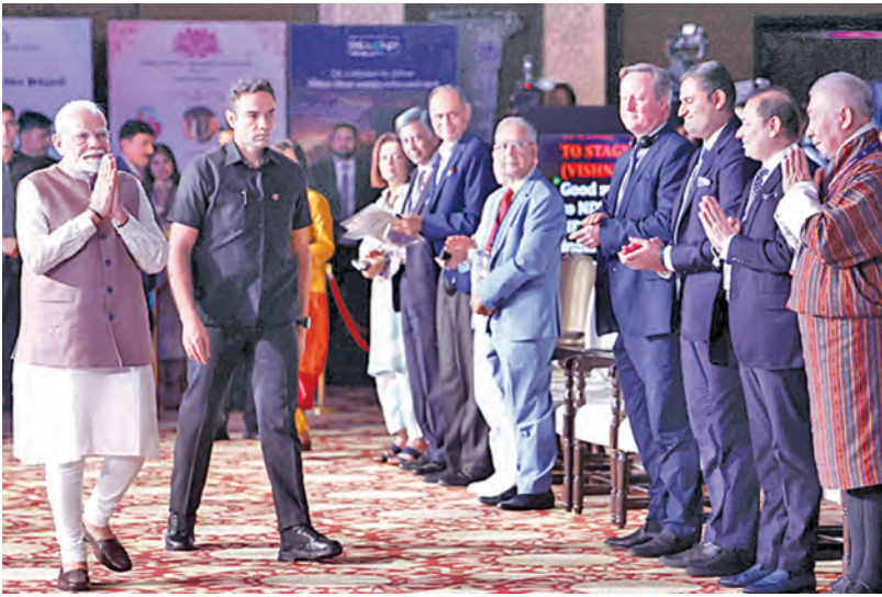
సోమవారం న్యూఢిల్లీలో ఎన్డీటివి వరల్డ్ సమ్మిట్-2024లో పాల్గొన్న ప్రధాని మోడీ