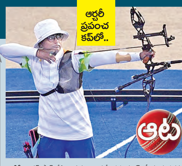
ఆర్థర్ ప్రపంచ కప్ లో..